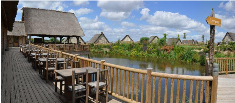
« Les îles de Clovis »

En fin de matinée, trajet direct vers Angers. Retour vers Lyon en TGV.